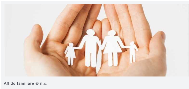
Affido familiare

ATTUALITÀ Altamura lunedì 02 maggio 2022 di La Redazione