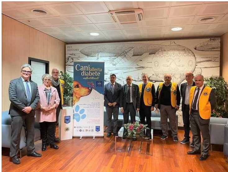
Lions Diabete_Airgest (2)

Con il ricavato dei liberi contributi dei passeggeri sarà donato un cane addestrato a prevenire le crisi glicemiche