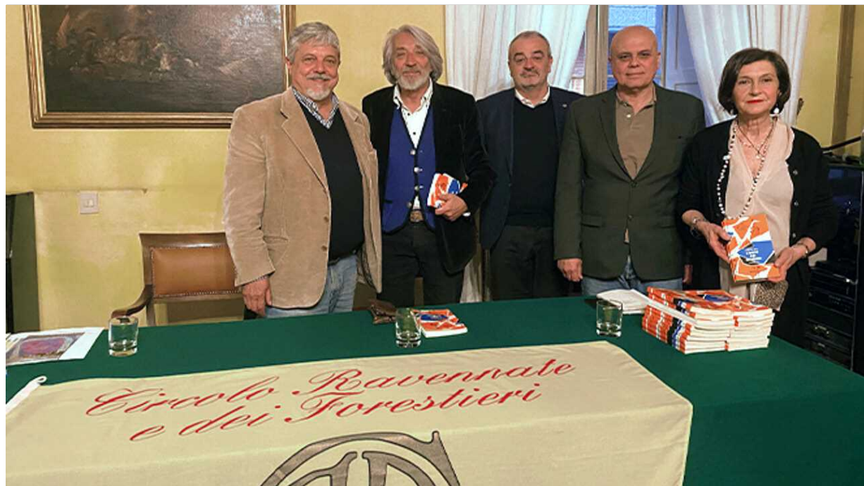
In foto la presentazione della ristampa

A l Circolo Ravennate e dei Forestieri è stata presentata in anteprima la ristampa del libro di Corrado Ricci "L'Arte dei bambini", scritto nel 1885. Il saggio fu prima pubblicato a puntate sul "Il Caffaro" e poi, nel 1887, l'Editore Zanichelli uscì con la prima edizione del volume. "Fu tra i primi, se non il primo studio in assoluto sul disegno infantile - commentano i promotori della ristampa - Corrado Ricci con l'aiuto di amici, maestre e maestri, ha raccolto disegni di bambine e bambini delle scuole primarie da cui elabora intuizioni psicologiche che dopo 130 anni sono ancora attuali".