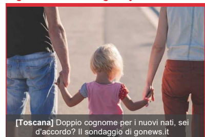
[Toscana] Doppio cognome per i nuovi nati, sei d'accordo? Il sondaggio di gonews.it