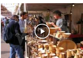
Torna Argilla: 250 ceramisti da tutto il mondo dal 2 al 4 settembre a Faenza | VIDEO

Articoli correlati Di più dello stesso autore