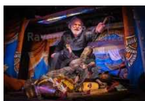
Festival Internazionale dei Burattini e delle Figure Arrivano dal Mare! Anteprima a Ravenna