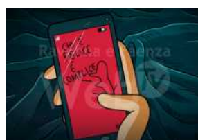
Scrittura festival: arriva Carofiglio e gli scarabocchi di Maicol&Mirco