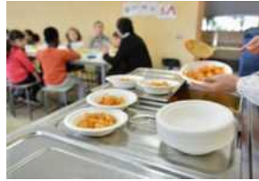
A Milano mensa scolastica gratuita per i profughi ucraini