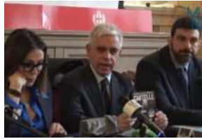
Fratelli d'Italia chiede la proroga delle cartelle esattoriali [VIDEO]