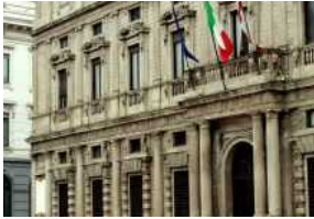
Palazzo Marino, nel 2022 diminuisce la tassa dei rifiuti