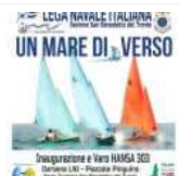
Un Mare Di Verso