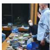
Lega Navale, riprendono gli