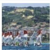
O'Pen Skiff, regata interzonale a San