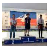
Vela, conferme per la Lega Navale