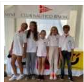
Lega Navale, bicchiere mezzo