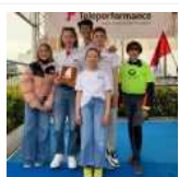
Vela, Circuito Nazionale O'Pen