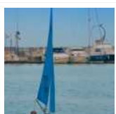
Mare e Disabilità, la Lega navale