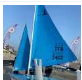
Un Mare Di Verso