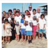
Interzonali O'Pen Skiff, successo per