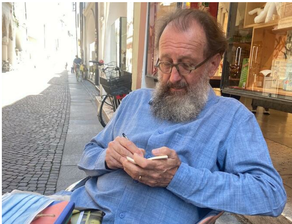
Michele De Lucchi

VARESE, 16 maggio 2022 –Dopo due anni di sospensione causati dalla pandemia, il 'Lumen Claro' riaccende i suoi riflettori e lo fa su un'archistar di livello mondiale. Sarà infatti il nome dell'architetto MICHELE DE LUCCHI ad aggiungersi all'Albo d'Oro del Lumen Claro, il premio che dal 1989 il Lions Club Varese Prealpi assegna alla personalità varesina che ha dato lustro al nostro territorio, distinguendosi nel campo delle professioni, delle arti e dell'economia. Il Lumen Claro – letteralmente "Onore all'illustre"– vuole stravolgere il famoso "Nemo propheta in patria" e nelle precedenti edizioni è stato conferito a personalità di spicco, dall'economista Alfredo Ambrosetti agli stilisti Ottavio e Rosita Missoni, dal pianista