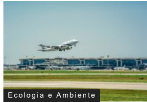
Ecologia e Ambiente