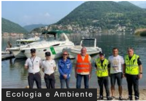
Ecologia e Ambiente

Giornata del Verde Pulito: ripuliti i fondali del Ceresio