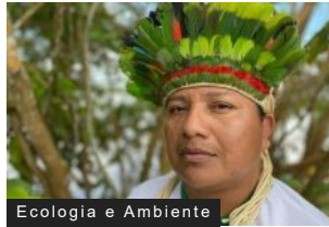
Ecologia e Ambiente

Giornata del Verde Pulito: ripuliti i fondali del Ceresio