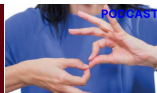
Pensieri a voce alta — 16 maggio 2022