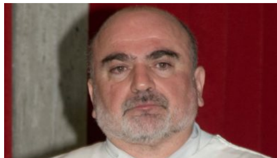
Diocesi — 16 maggio 2022

A bordo campo Don't worry B happy Fotosofia La campanella Qui Famiglia Primo Piano