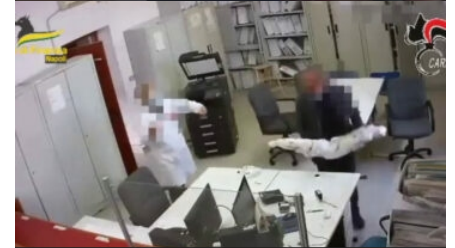
Corruzione, 15 indagati nel Napoletano