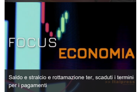
Saldo e stralcio e rottamazione ter, scaduti i termini per i pagamenti