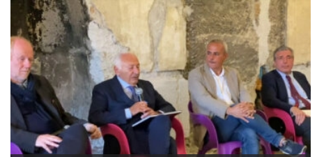
Siciliani a scuola da Mogol, dalla Regione 30 borse studio