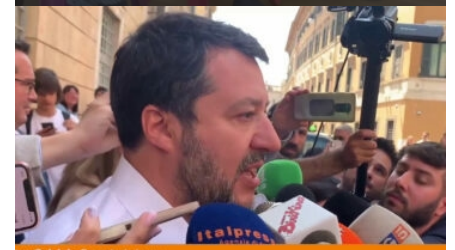
Salvini "Per la Lega la priorità è pace e lavoro"