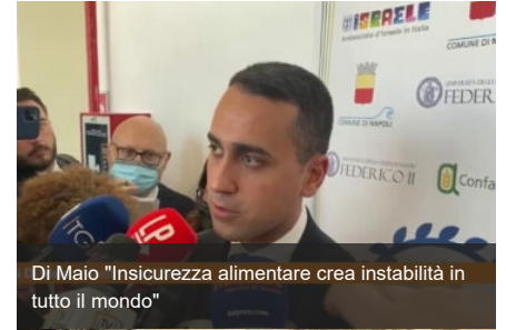
Di Maio "Insicurezza alimentare crea instabilità in tutto il mondo"