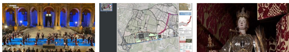
Nota, la Fanfara dei carabinieri Siracusa, nuovo ospedale: Patrocino di Santa Lucia: