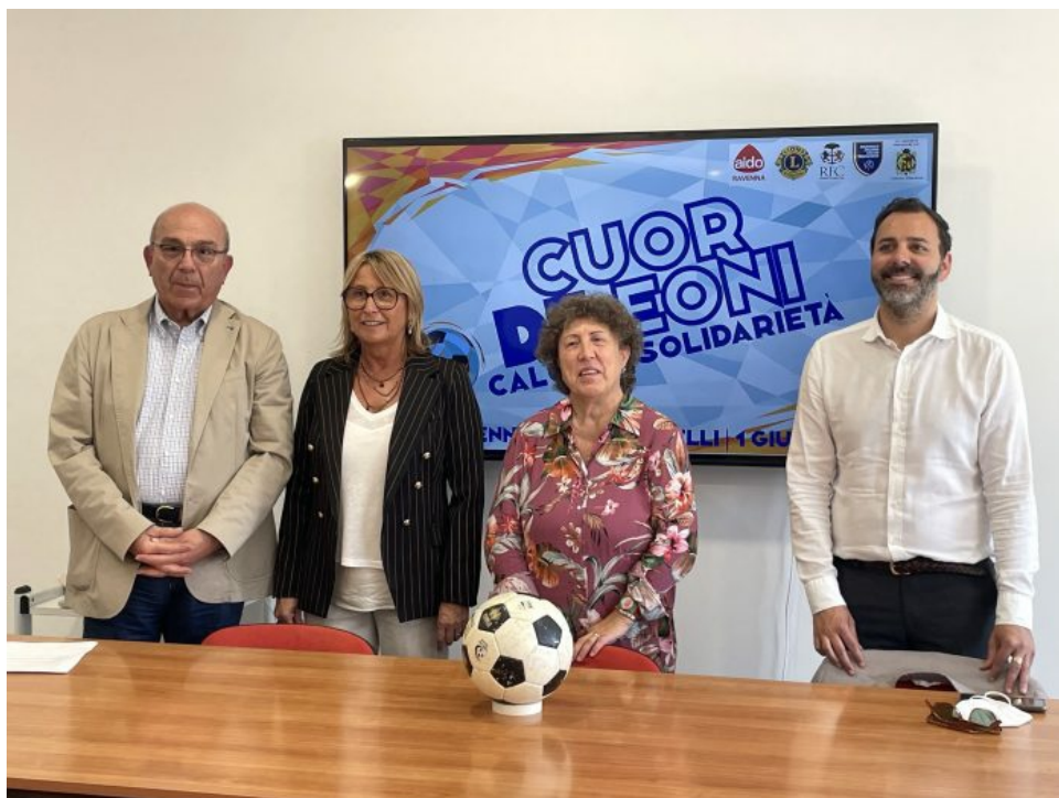
"Cuor di leoni, calcio e solidarietà"