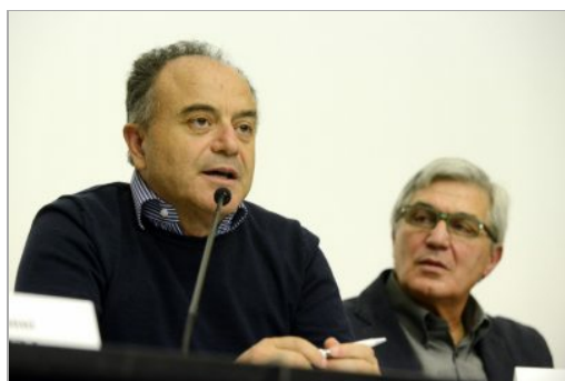
Al microfono Nicola Gratteri in una foto d'archivio

Il Comune di Ancona conferirà lunedì prossimo, 23 maggio, la cittadinanza onoraria a Nicola Gratteri, procuratore della Repubblica presso il Tribunale di Catanzaro. La cerimonia si terrà alle ore 18, nella sala del Consiglio di Palazzo degli Anziani in piazza Stracca. Il conferimento ufficiale della