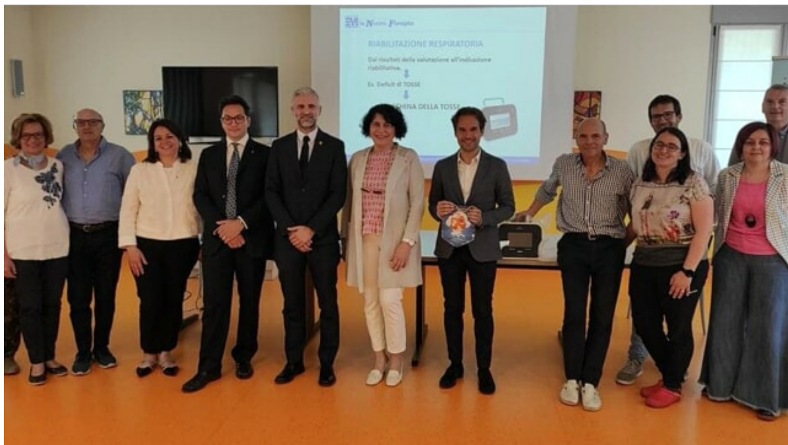
I Lions e La Nostra Famiglia

Una donazione per l’acquisto di una “macchina della tosse”, attrezzatura elettromedicale utile ai bambini con difficoltà respiratorie che accedono ai servizi de “La Nostra Famiglia” di Conegliano. Protagonista dell’iniziativa, che porta il nome de “Riabilitazione respiratoria”, il sodalizio tra Lions Club di Pieve di Soligo e la Onlus “We Serve Lions 108ta2”. Mercoledì 18 maggio, alle ore 11, nella sede coneglianese de “La Nostra Famiglia” la consegna dei proventi raccolti grazie alla generosità dei soci Lions , dei cittadini e delle realtà imprenditoriali del territorio.