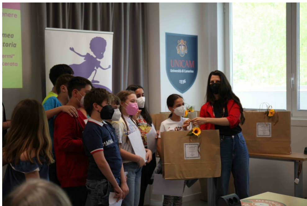
La scuola Enrico Fermi di Macerata

dell'importanza dello stare insieme, in presenza, gli uni accanto agli altri. Più di 160 tra bambini e bambine, ragazzi e ragazze provenienti dalle scuole di Macerata, Treia, Camerata Picena, Fossombrone, Fano e Urbino insieme a docenti, dirigenti scolastici e persino un sindaco sono stati i protagonisti e le protagoniste di questa cerimonia. La comunità educante, insomma, di cui tanto si parla e poco si pratica, ha preso forma nella sala del Polo di Informatica dell'Università di Camerino». Giovedì 19 maggio, infatti, nel Polo di Informatica dell'Università di Camerino si è tenuta la cerimonia di premiazione della V edizione del concorso didattico "Sulle vie della parità nelle Marche – a.s. 2021/2022".