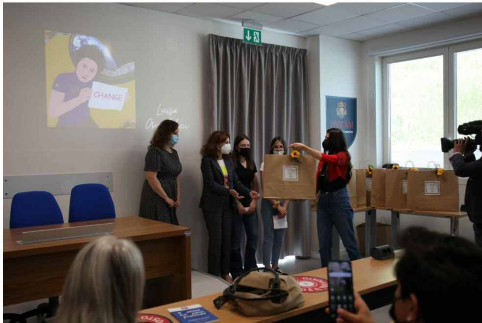
La scuola Paladini di Treia

«Non è stata una semplice cerimonia – racconta l'Osservatorio di genere – quella che è andata in scena giovedì mattina: è stata una vera e propria festa, una riappropriazione degli spazi, un'affermazione gioiosa, seppur rispettosa delle regole imposte dalla pandemia,