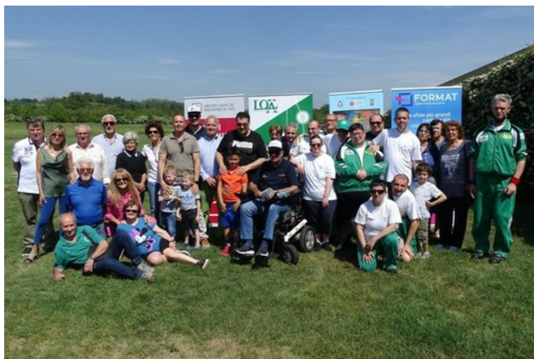
Il gruppo partecipanti all'iniziativa "Ti insegnerò a volare"

Un intermeeting con il Lions Club Asti che ha consentito a una trentina di ragazzi diversamente abili di sperimentare l'emozione del volo