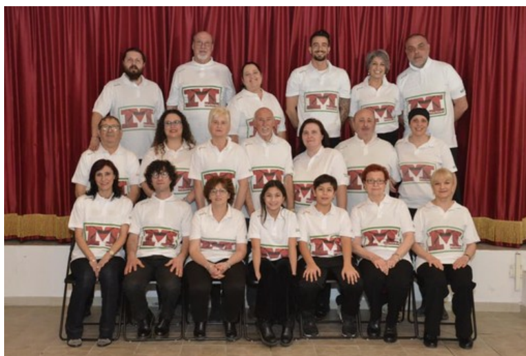
La compagnia teatrale in una foto di archivio

In scena "Gennaro Belvedere, testimone cieco", una commedia brillante in due atti, per aiutare la piccola Sofia e l'associazione "Diversamente Felici Onlus"