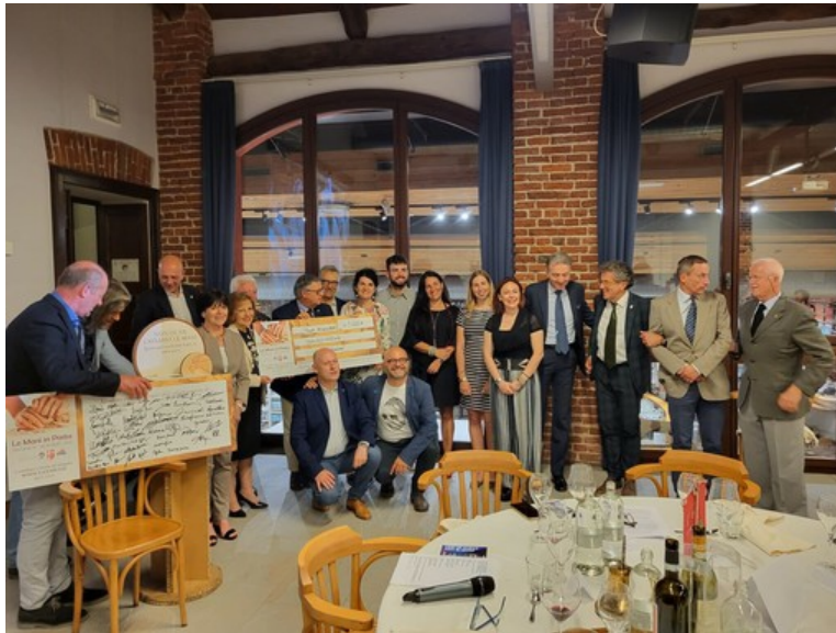
La cerimonia di consegna

Ieri gli organizzatori hanno consegnato il ricavato al Consorzio