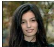
Gala GIRACE Attrice