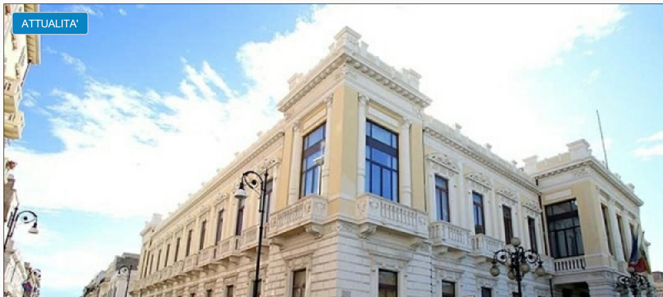
A PALAZZO ALVARO