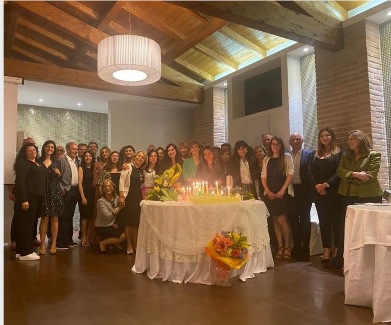
Fidapa Avezzano, cerimonia delle candele, luci di pace e speranza