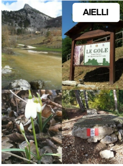
Le nostre montagne raccontano: le Gole di Aielli-Celano