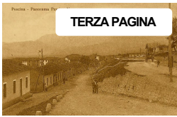
Evidenti disparità nella Marsica attenuate dalla propaganda fascista (settembre 1928)