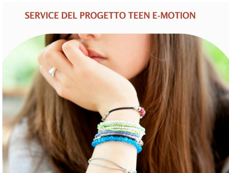
Post di Instagram - Ti aspettiamo martedì 31 maggio alle 20,30 al Teatro Verdi, sostieni con noi il progetto Teen E-Motion (Storia di Instagram) (Post di Instagram)

🕒 29 Maggio 2022 11:37 📍 Attualità 📍 Pisa