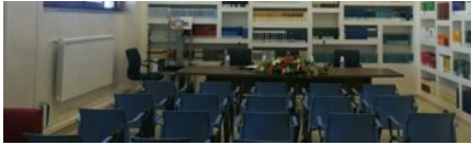
A Palazzo D'Aimmo inaugurati i nuovi locali della Biblioteca del Consiglio regionale del Molise