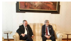
Campobasso, il Prefetto Cappetta incontra l'ambasciatore britannico a Roma 27 Maggio 2022