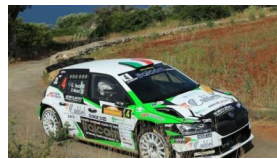
Rally del Salento, quarto posto per Giuseppe Testa 30 Maggio 2022