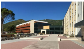
Al Neuromed l'undicesimo workshop nazionale sulla NeuroInformatica 30 Maggio 2022