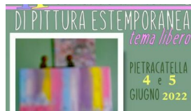
Pietracatella, dopo 10 anni torna l'estemporanea di pittura: appuntamento dal 4 al 5 giugno 30 Maggio 2022