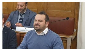
Campobasso, nuova sede della Sea: interrogazione urgente di Tramontano in Consiglio comunale 30 Maggio 2022