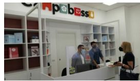
Inaugurato il nuovo Infopoint turistico del Comune di Campobasso 30 Maggio 2022