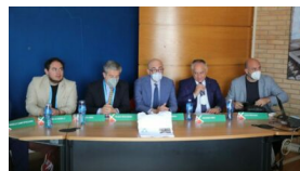
Finali Nazionali Giovanili CRAI under 15 di pallavolo maschile, presentata la kermesse in programma in Molise 28 Maggio 2022