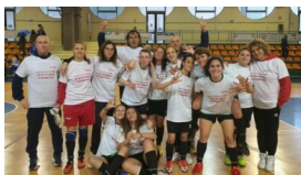
Calcio femminile, l'Adriatica Campomarino conquista il titolo regionale 30 Maggio 2022