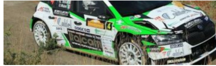
Rally del Salento, quarto posto per Giuseppe Testa