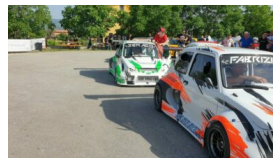
Lo slalom Città di Campobasso, memorial Gianluca Battistini, entra nel vivo 28 Maggio 2022