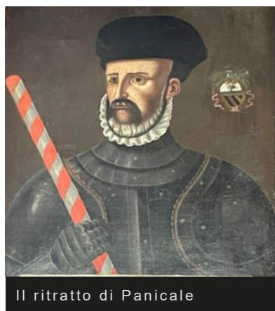
Il ritratto di Panicale