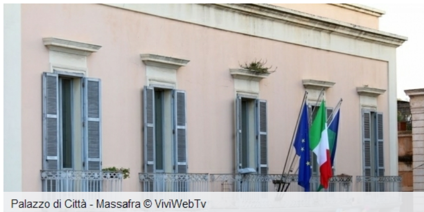
Palazzo di Città - Massafra