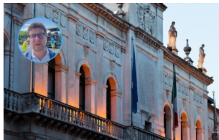
150 mila euro per via Baiardi a Mortise. Continuano i lavori di riqualificazione urbana a Padova.