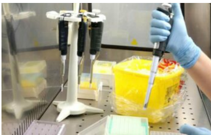
Salute: identificato un caso di vaiolo delle scimmie in Fvg