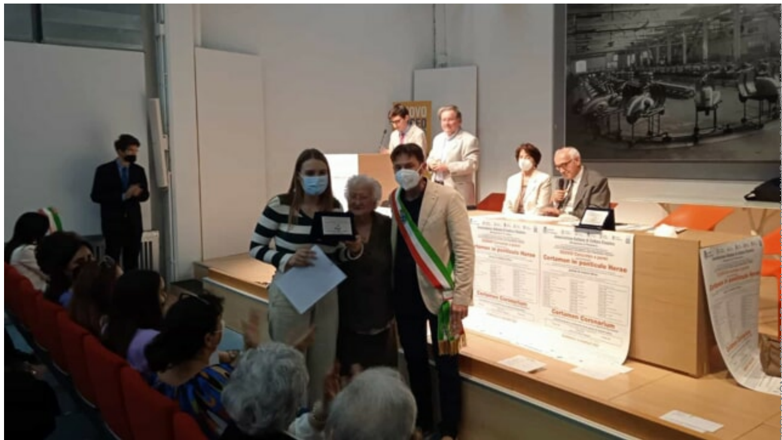
Un momento della premiazione

Al Museo Piaggio si sono svolte le premiazioni della 38esima edizione del Certamen che, due settimane fa, ha radunato, a Pontedera, decine di studenti provenienti da ogni parte della Toscana, che si sono confrontati sul passo di un autore latino.