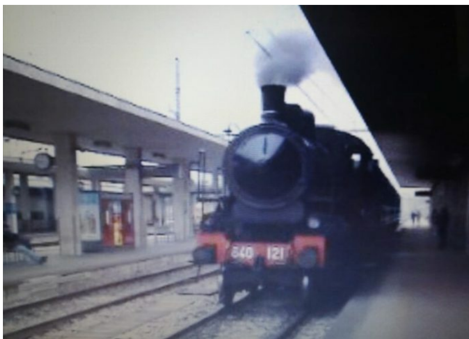
Il primo treno di Dante allestito sulla tratta Firenze-Ravenna il 3 giugno 2007