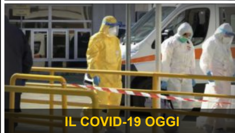
IL COVID-19 OGGI