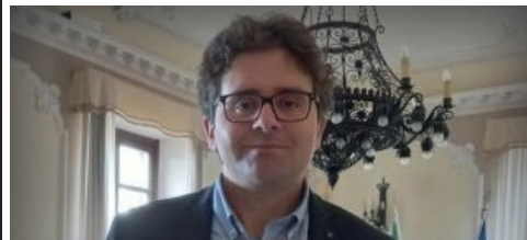
MESSAGGIO DEL PRESIDENTE