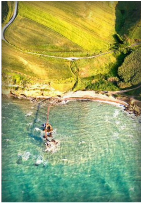
Vasto il mare per le tue Vacanze...