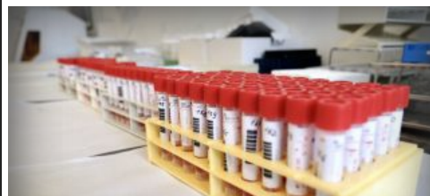
IL COVID-19 OGGI