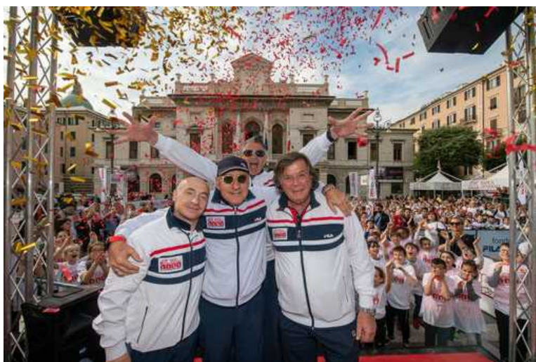
Adriano Panatta, Martin Castrogiovanni, Francesco Graziani e Andrea Lucchetta a Sanremo per 'Un Campione per Amico'