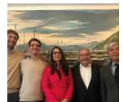
Yacht Club Italiano