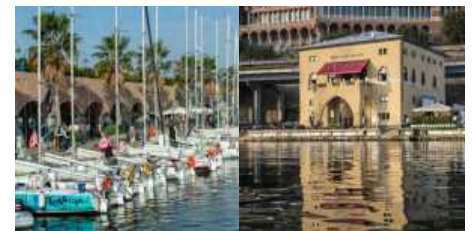
C.N. Marina Genova Aeroporto