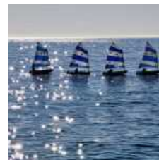
Club del Mare Diano Marina