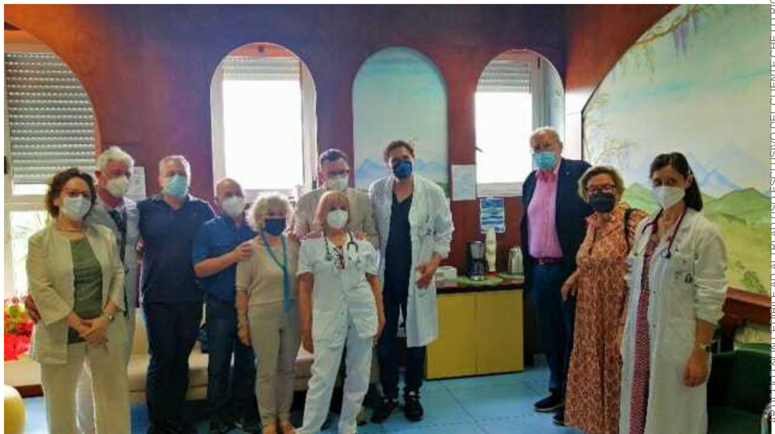
Il nuovo reparto dell’ospedale di Fabriano