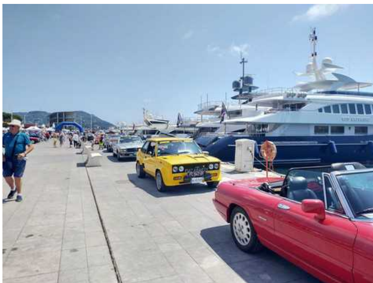
Mercatoretrò in Calata Anselmi a Imperia