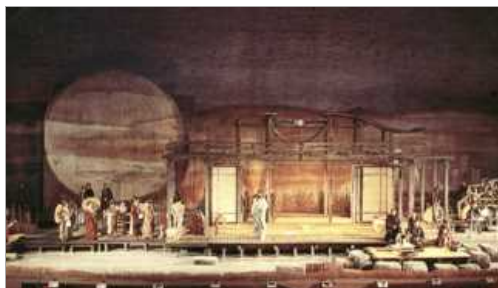
La Madama Butterfly del 1972