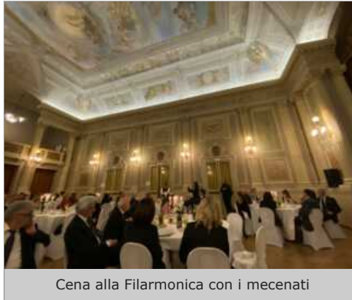
Cena alla Filarmonica con i mecenati

CHI SONO I MECENATI – A poco più di un mese dal debutto del Macerata Opera Festival si sono già raggiunte le 91 adesioni al gruppo dei Cento Mecenati che, su modello dei Cento Consorti, da alcuni anni sostengono le attività del Macerata Opera Festival. Si tratta soprattutto di professionisti, appassionati e vicini al monumento e all'attività musicale, più che grandi realtà industriali. Rimangono quindi gli ultimi nove posti, con alcuni mecenati già in fase avanzata di ingresso.