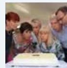
FOTO. Il Ponte del Sorriso compie 30 anni e premia i volontari: «Tutto cominciò con una riunione di sei mamme» (h. 17:52)