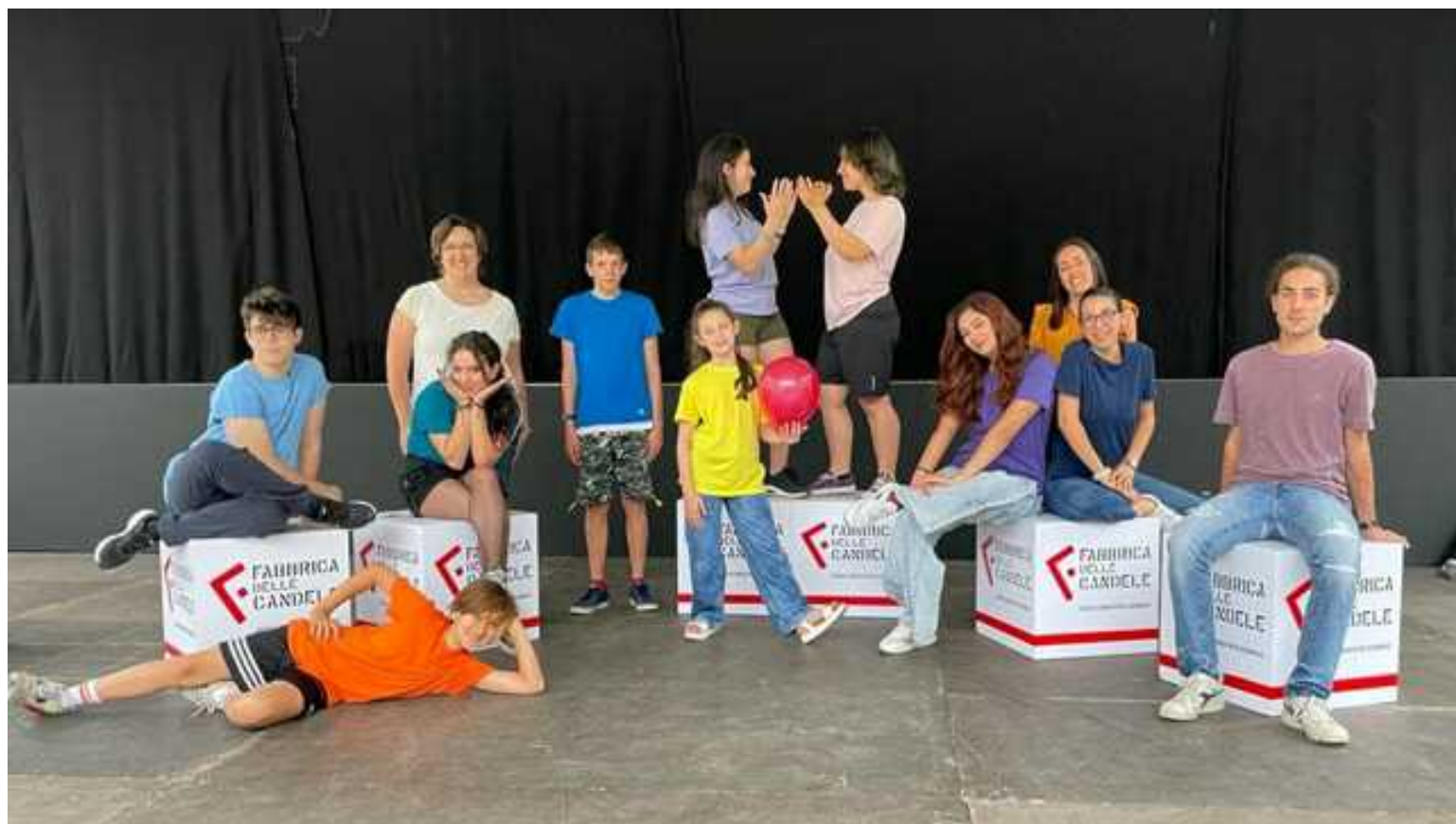
I giovani attori dello spettacolo

"Un successo al di sopra delle aspettative". Lo spettacolo teatrale "L'insostituibile dolcezza del vivere", per la regia di Denio Dorni, ha fatto il pieno di pubblico sabato scorso alla Fabbrica delle Candele. È stato il Lions Club Forlì Host a proporre e sostenere con convinzione il progetto di teatro-terapia (una esperienza teatrale che ha dato ottimi risultati in altri campi), rivolto per la prima volta agli adolescenti diabetici. Il lavoro si è incentrato sulla costruzione collettiva di un percorso di crescita, di accettazione e di consapevolezza utilizzando linguaggi nuovi per esplorare la possibilità di vivere serenamente, senza remore o paure la propria condizione, amando se stessi e, appunto, "L'insostituibile dolcezza del vivere".