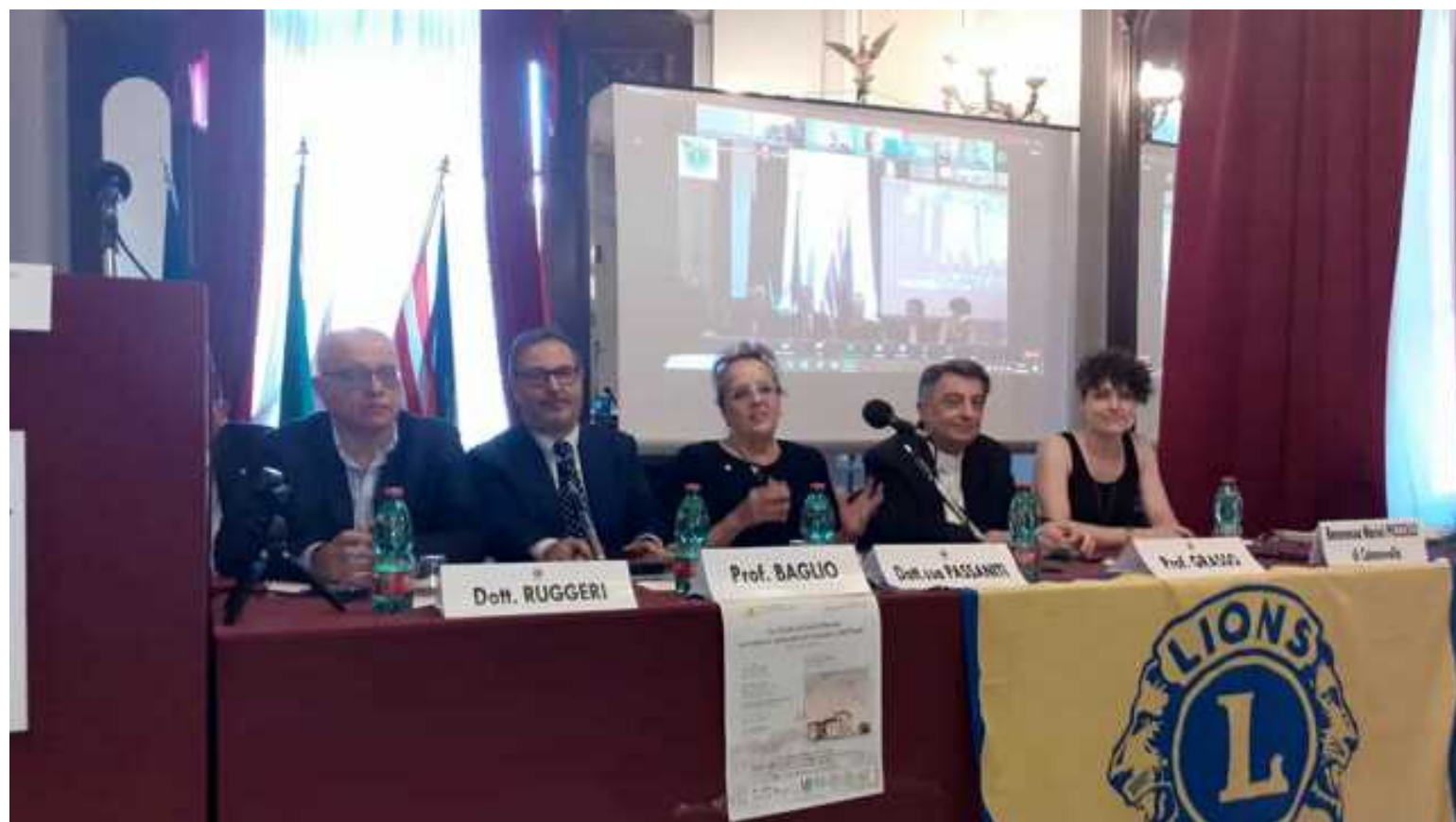
Tavolo dei relatori Lions

L a Sicilia di Lucio Piccolo nel rilancio culturale ed economico dell'Isola". Di questo si è discusso al convegno tenutosi martedì 14 giugno ore 17 nel Salone degli Specchi della Città Metropolitana di Messina, organizzato da Lions e Leo Club Messina Ionio a chiusura dell'anno sociale, che ha viste impegnate numerose personalità della cultura.