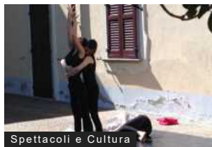
Spettacoli e Cultura

Masnago in Festa tra Palio, sport e gastronomia