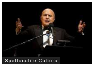
Spettacoli e Cultura

Festival della Valle Olona: spettacolo di Tekno Teatro Open a Villa Greppi Gonzaga di Olgiate Olona