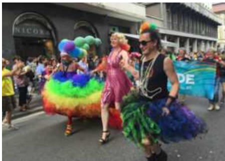
Torna il Varese Pride

Nella Biblioteca Civica tornano poi gli appuntamenti con la rassegna #INBIBLIOTECA: sabato alle 21.00 spazio per i giochi da tavolo per grandi e piccini, mentre domenica ci sarà un laboratorio di disegno. Sabato alle 10.30 invece in Sala Montanari appuntamento con la presentazione del libro sulla Tre Valli Varesine, mentre domenica 19 è il momento di Note sull'acqua, raduno bandistico alla Rasa di Varese. Sabato pomeriggio poi ci sarà la Varese Pride in occasione della Pride Week 2022.