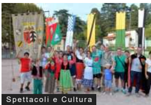
Spettacoli e Cultura

Masnago in Festa tra Palio, sport e gastronomia