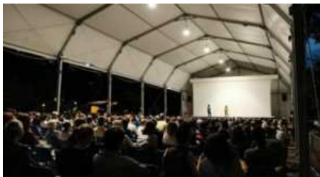
La Tensostsruuttura dei Giardini Estensi

di vita è profondamente legato alla nostra città. Nelle sale del Castello di Masnago prende vita da oggi, venerdì 17 giugno fino al 20 novembre, una mostra inedita dedicata a uno dei grandi esponenti dell'arte del Novecento: I tempi della pittura. Cronografia di alcune opere di Renato Guttuso dipinte a Velate: l'archivio di Nino Marcobi, mostra a cura di Fabio Carapezza Guttuso e Serena Contini.