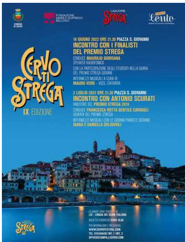
Incontro con i finalisti del Premio Strega 2022 a Cervo