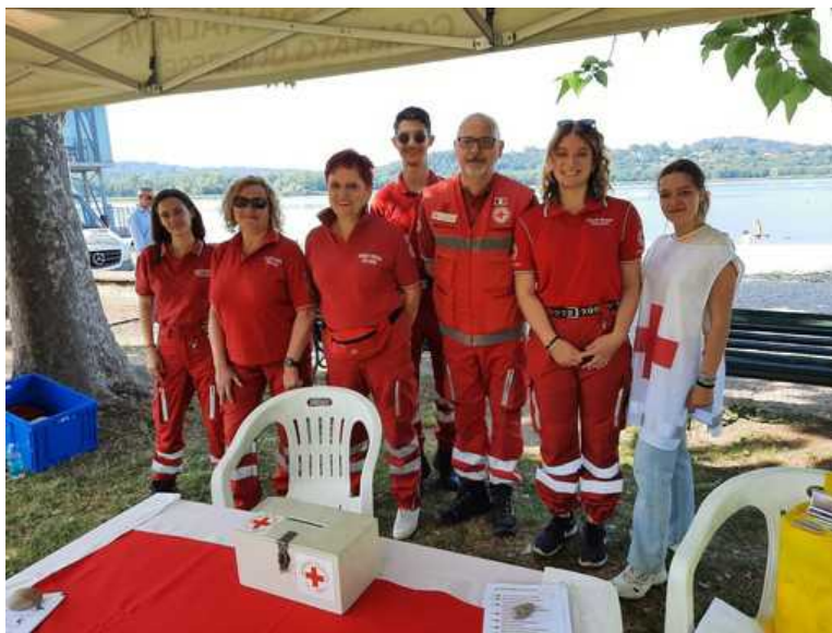
Lo stand della Croce Rossa Italiana Comitato di Varese vi attende alla Schiranna

In corso Vivilago 2022: c'è anche lo stand della Cri varesina, sempre in prima fila per la tutela di salute e ambiente, tra il Lido e la Canottieri Varese