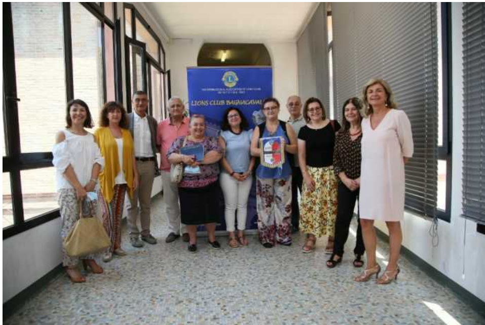
Cerimonia di consegna e ringraziamento degli arredi per il nuovo ambulatorio di psicologia, donati da parte del Lions Club di Bagnacavallo

Avviato in via sperimentale a metà settembre del 2021 il nuovo percorso di consultazione psicologica introdotto dall'Ausl Romagna sta dando oggi risultati soddisfacenti