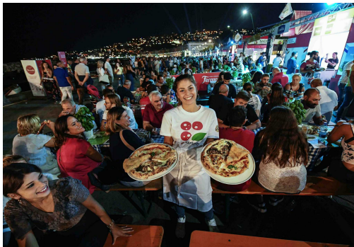
Pizza Village, Pizzaiuoli E Influencer A Scuola Di Olio Evo

NAPOLI – È il più utilizzato, ma anche il meno conosciuto degli alimenti della dieta mediterranea. È l'olio extra vergine di oliva. Alla grande kermesse del