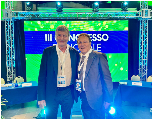
UILA, Lavoratori Protagonisti Del Comparto Agro-Alimentare

RIFREDDO di PIGNOLA (Pz) – La UILA rilancia il ruolo di protagonismo dei lavoratori del comparto agro-alimentare, "strategico" per lo sviluppo futuro e per nuova