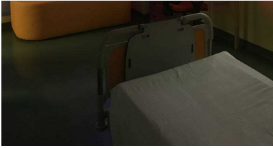
Un ambulatorio Pass

presidio e direttore della rete ospedaliera dell’Azienda USL Tc ha spiegato così il Progetto: “L’Ambulatorio è situato in un’area centrale (contigua anche all’area della medicina d’urgenza), che è stata riconvertita con interventi strutturali per un importante impegno finanziario da parte dell’Azienda; ma è grazie ai Lions se uno degli spazi di questo nuovo servizio è stato allestito per offrire tutte le caratteristiche del massimo comfort: dalle pareti colorate