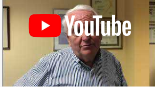
Da Novi al Sudafrica: le macchine agricole di