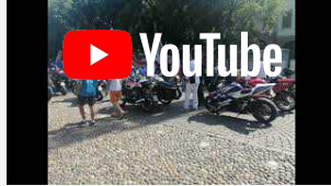
Tante e belle motociclette domenica a Mirandola.