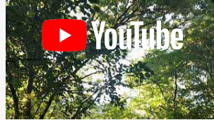
A spasso nel bosco di San Felice sul Panaro