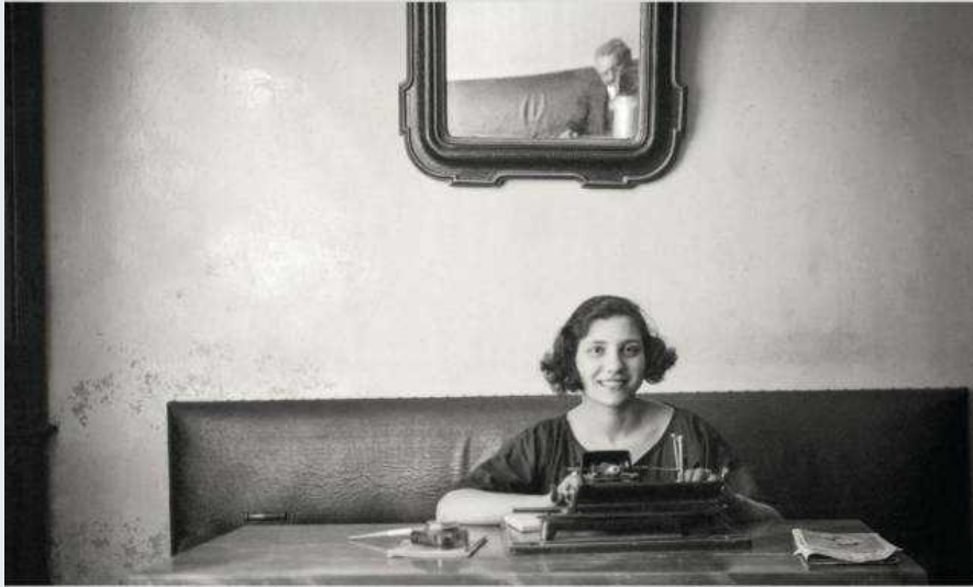
SABATO 2 Luglio 2022

MOSTRA ITINERANTE 2 Luglio - 25 Settembre 2022 FOIANO DELLA CHIANA