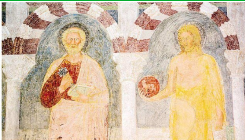
Da sinistra, Maestro della cappella Bonghi, «Crocifissione» e «San Pietro e San Giovanni Battista», terzo decennio XIV secolo (particolari), Convento di San Francesco, Bergamo