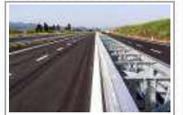
PIOMBINO: PUBBLICATA LA PROCEDURA PER LA PROGETTAZIONE DEL 2° LOTTO DELLA SS398