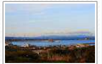
RESIDENTI TOLLA: BASTA CHIACCHERE E PASSERELLE SUL RIGASSIFICATORE