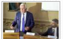
PIOMBINO: IL CONSIGLIO DICE NO AL RIGASSIFICATORE, MA SNAM CHIEDE LA BANCHINA PER 25 ANNI