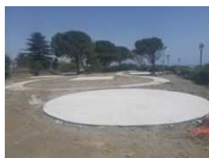
SIDERNO Il lungomare cambia volto. Aspettando "Immersi nel Blu"