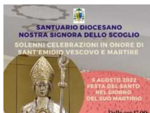
SANTUARIO NS. SIGNORA DELLO SCOGLIO I prossimi appuntamenti