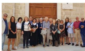
Jesi / Insieme per festeggiare i 50 anni dalla maturità: era il 1972