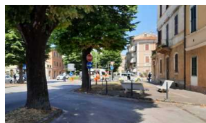
Jesi / Abbattimento tigli di Viale Trieste: il Comitato dal Sindaco