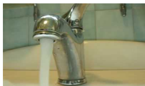
Jesi / Emergenza idrica, scatta l'ordinanza del Sindaco