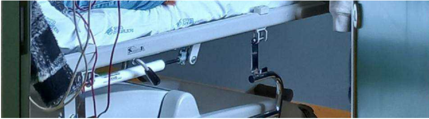
Pet therapy con il Salesi